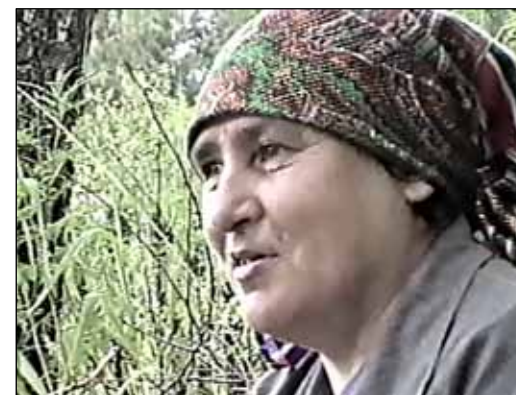
№ 136. Кадр из очерка «Художник»

Я её днём видели в столовой турбазы - она мыла посуду. Ну, думаю, сейчас нам влетит.