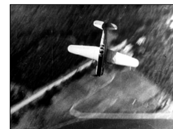
№ 140. Кадры из фильма «Владимир Мартемьянов»