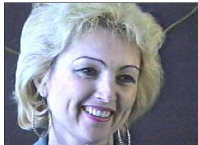
№ 141. М. Чуб. Кадр из фильма «Сельская учительница»

Что бы ни говорили вам о замысле, помните, мысль материальна. Мыслить вредно - мысли сбываются.