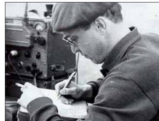
№ 139. Кадр из фильма «Владимир Мартемьянов»

Узнав, когда у него тренировки, поехал на старый аэродром, просто посмотреть. Впечатление было чарующее.