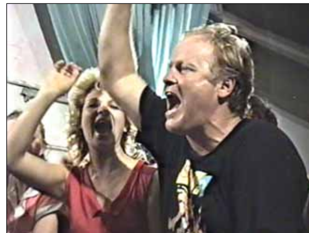
№ 142. Б. Золотов. Кадр из очерка «Куда идём?»