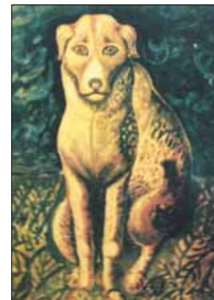
№ 134. И.Селиванов. Собака

Какие это были чудесные картины! Тут и кот, тут и собака, тут и петух, тут и корова. Все они нарисованы необычно. Голова маленькая, а хвост большой.